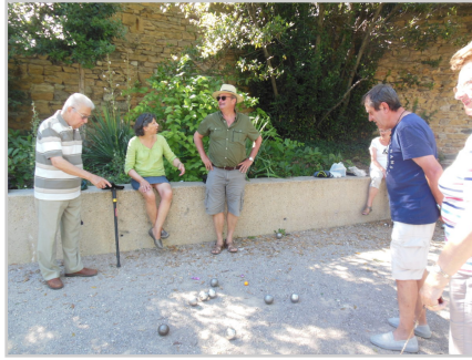
partie de pétanque

Retrouvez plus d'informations et participez sur la plateforme, lien direct vers la fiche action : https://www.cestpossible.me/action/equipages-un-espace-seniors-et-intergenerationnel/