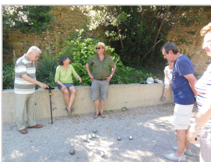
partie de pétanque

Retrouvez plus d'informations et participez sur la plateforme, lien direct vers la fiche action : https://www.cestpossible.me/action/equipages-un-espace-seniors-et-intergenerationnel/