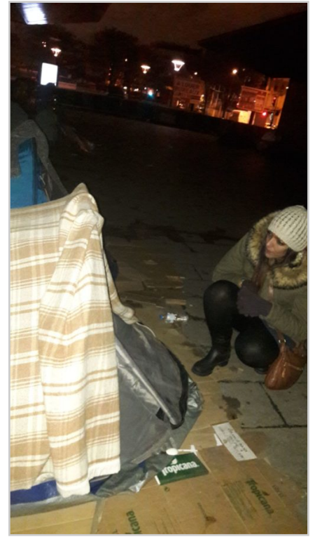
de la chaleur humaine