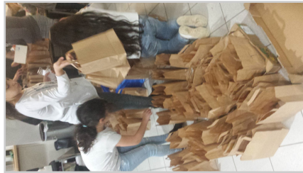
la chaîne de solidarité