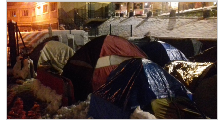
des conditions difficiles

Retrouvez plus d'informations et participez sur la plateforme, lien direct vers la fiche action : https://www.cestpossible.me/action/des-habitants-du-val-doise-en-aide-aux-sans-abris/