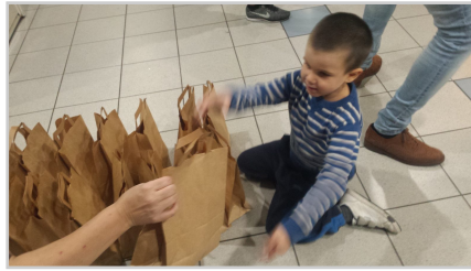
la solidarité n'a pas d'âge