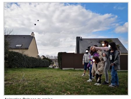
Animation Balance ta graine