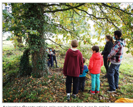
Animation Constructions minuscules en lien avec le projet d'aménagement dans le quartier