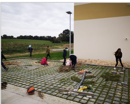
Land'art dans le quartier