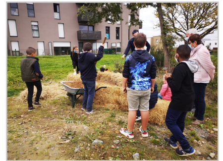
Création d'un potager en paille avec les jeunes de la ville