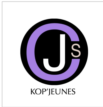
Logo de la "KopJeunes"