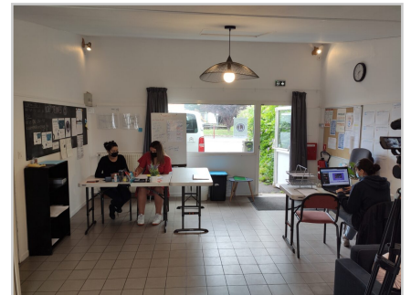
Local / Bureau de la CJS

Retrouvez plus d'informations et participez sur la plateforme, lien direct vers la fiche action : https://www.cestpossible.me/action/la-kopjeunes-cooperative-jeunesse-de-services/